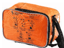
Сумка для хранения и ношения