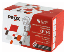
Коробка для хранения

Самоспасатель в герметичном пакете упаковывается в коробку или сумку, на которых размещается памятка по применению. Упаковка пломбируется, вскрывается в случае пожара или ЧС техногенного характера. По спецзаказу возможна упаковка самоспасателя в футляр.